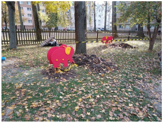
Verő J. utca – Aranyhegy