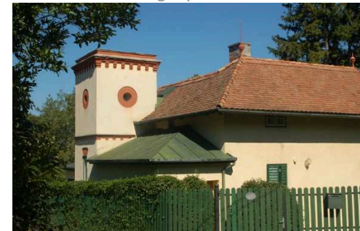
Győri út 9.