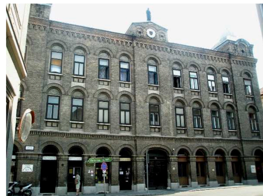
Balfi út 95.