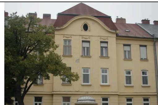
Hársfa sor 29.