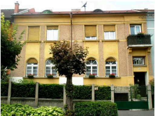
Madách u. 32.