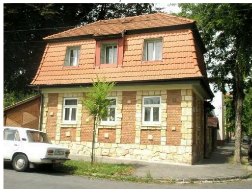
Zrínyi u. 46.-48. - Mikoviny u. 39.