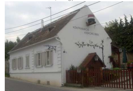
Balfi út 1-3.