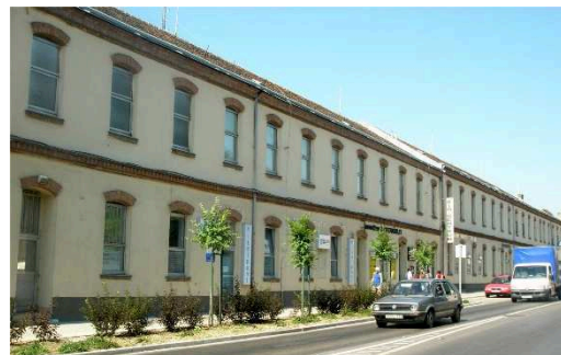
Deák tér 14.