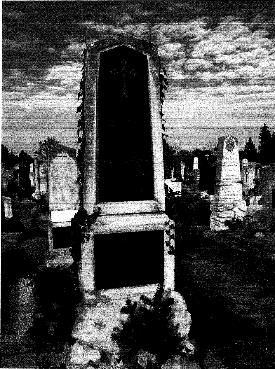
Új Szent Mihály temető II. csoport 12. sor 144.sz. sírhely